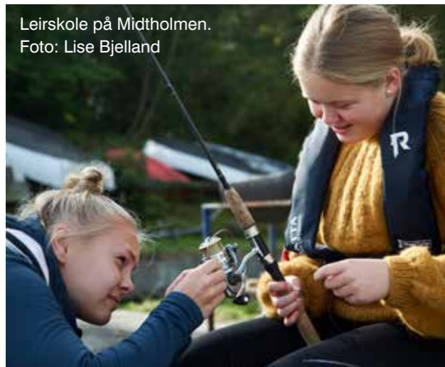
Leirskole på Midtholmen.