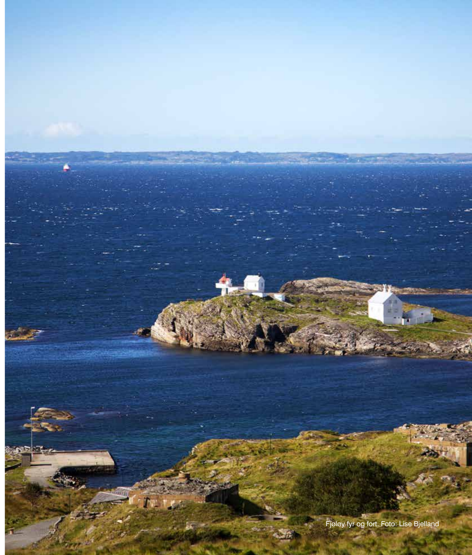
Fjøløy fyr og fort.