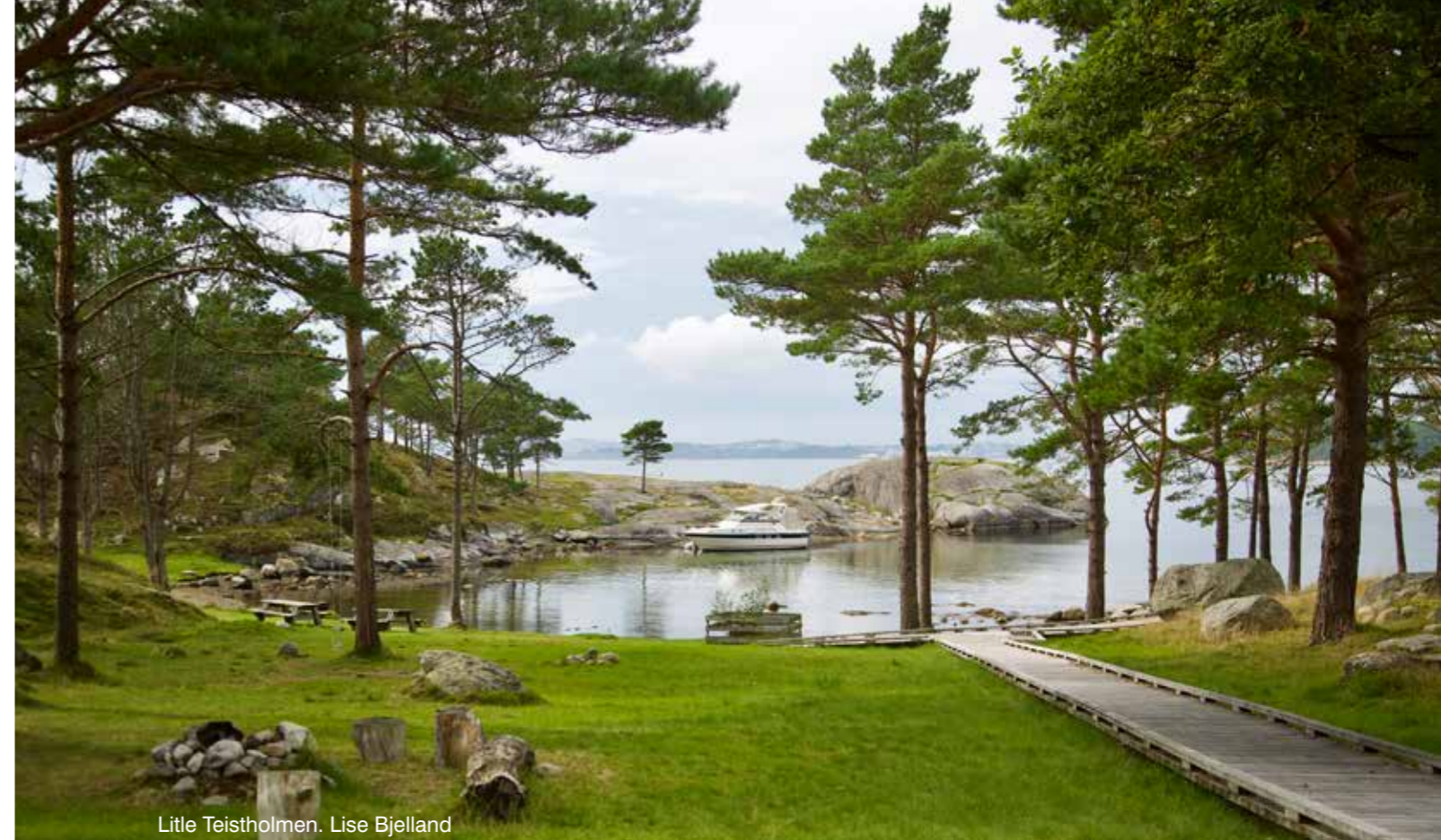
Little Teistholmen. Lise Bjelland

Båtlivet bidrar årlig til drøyt 2,5 milliard i omsetning til lokalt næringsliv; bunkers, proviant, overnatting, restaurant, friluftslivsutstyr m.m. Ryfylke Friluftsråd