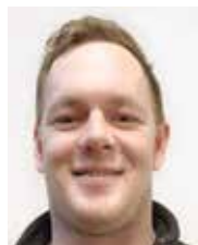
Glenn Rørheim Lærlingbygd drift