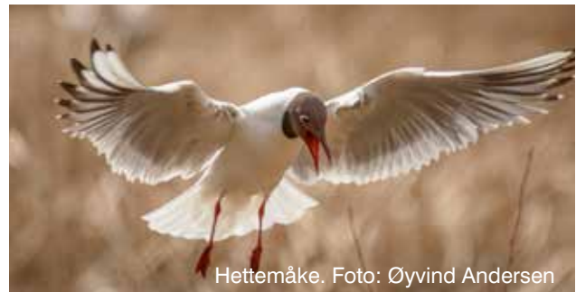
Hettemåke.