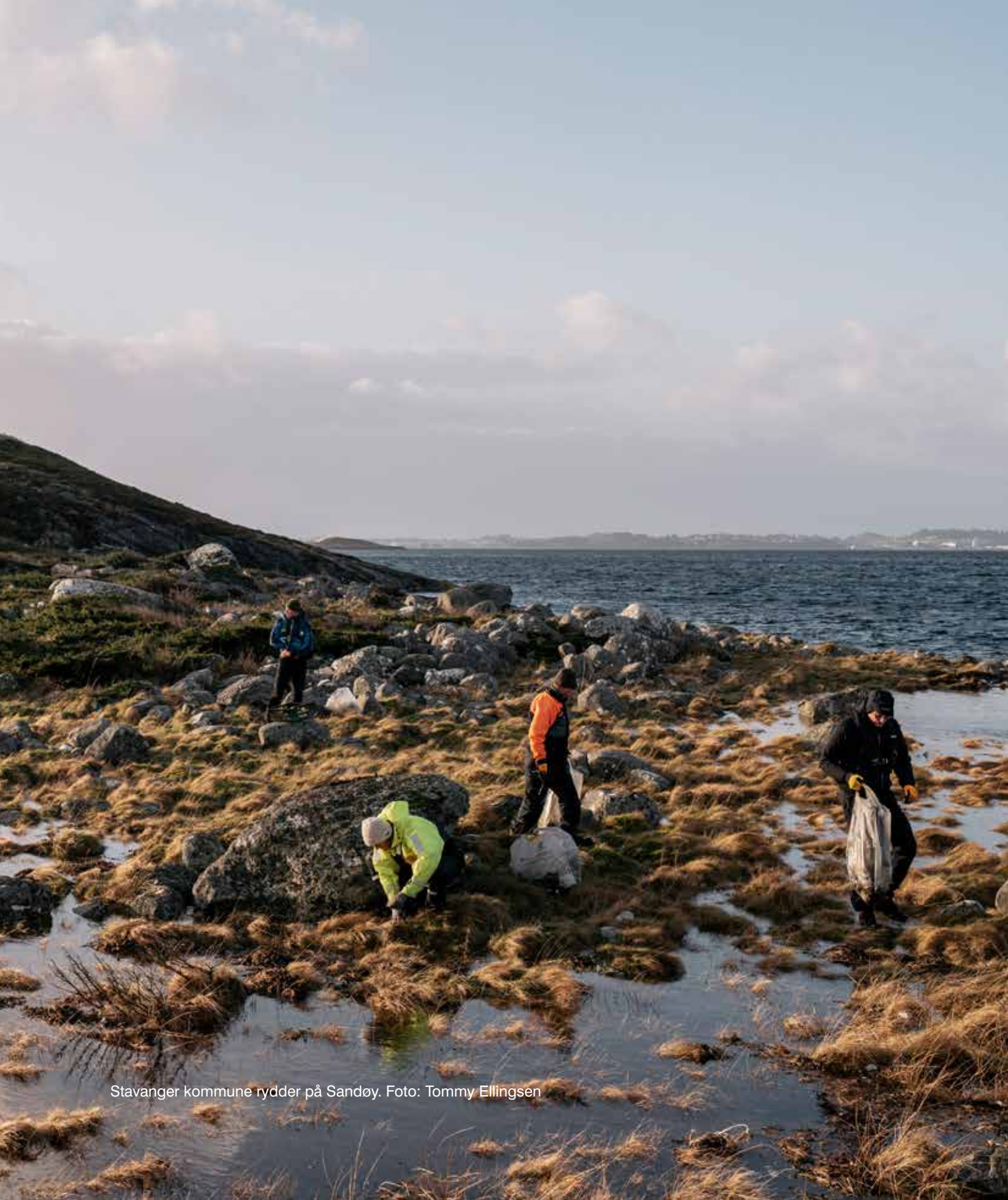
Stavanger kommune rydder på Sandøy.