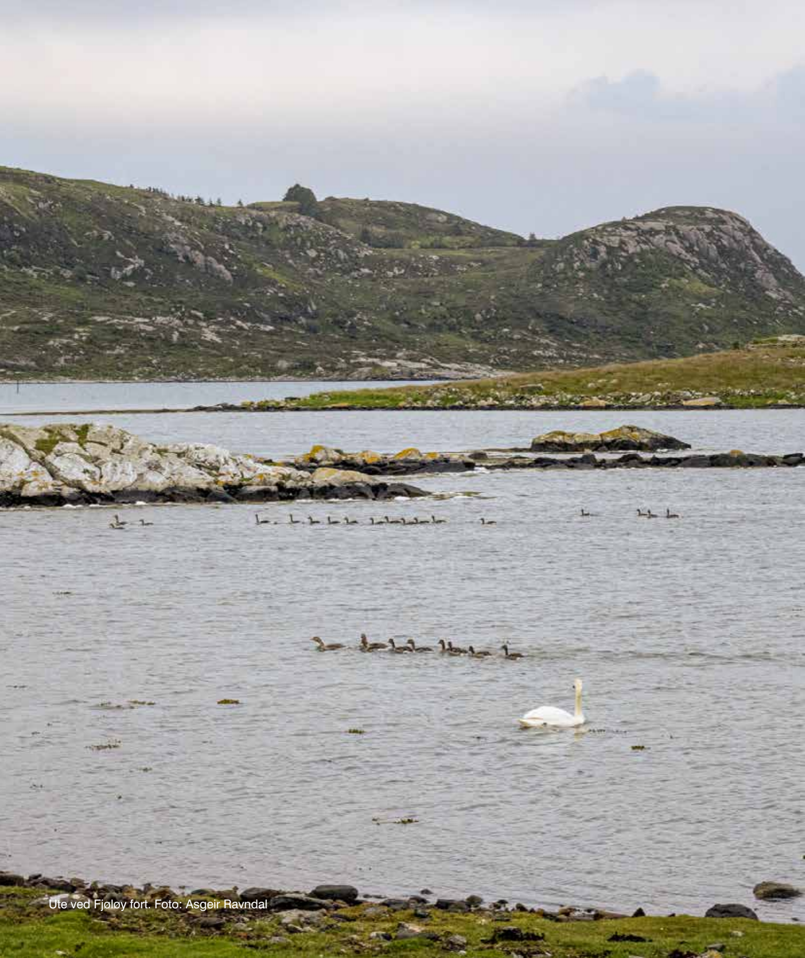
Ute ved Fjøløy fort.