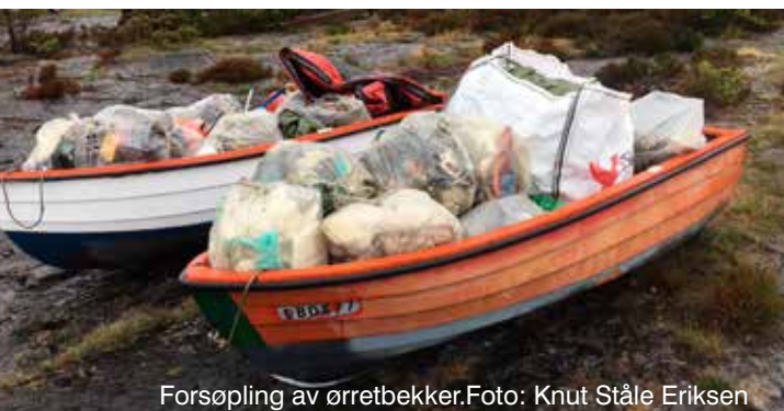
Forsøpling av ørretbekker.

Forhandlingskompetanse knyttet til avtale om kjøp, leie og servitutt på regionale friområder.