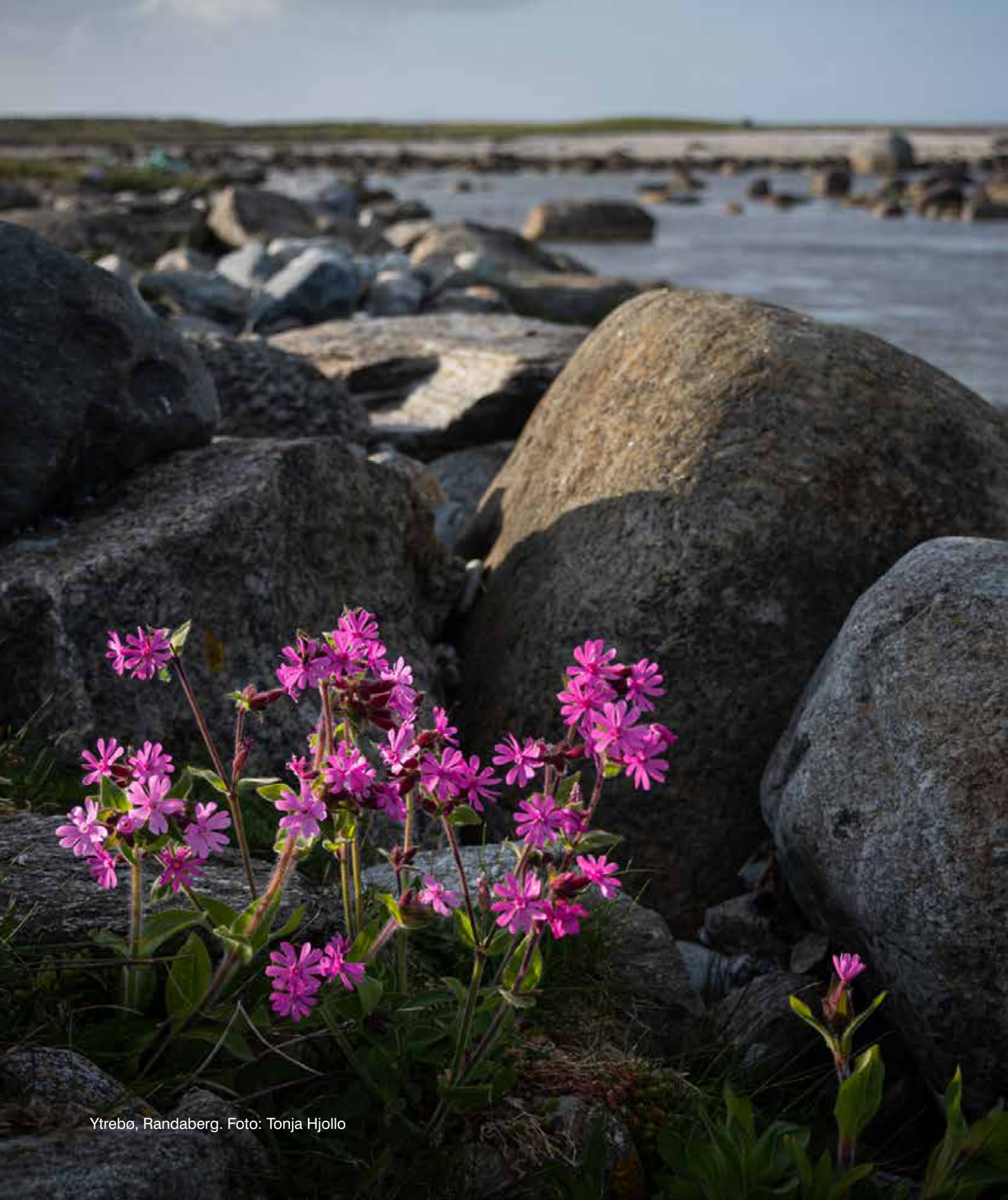
Ytrebo, Randaberg.