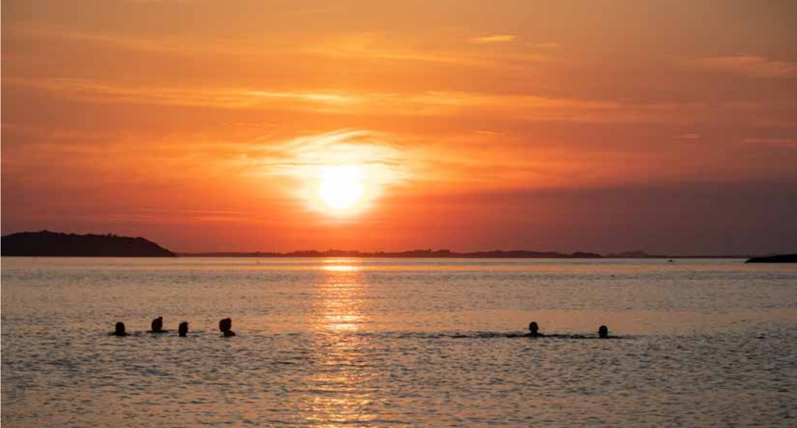
Sandestranden, Randaberg.