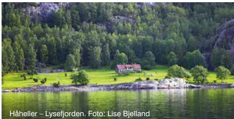
Håheller – Lysefjorden.