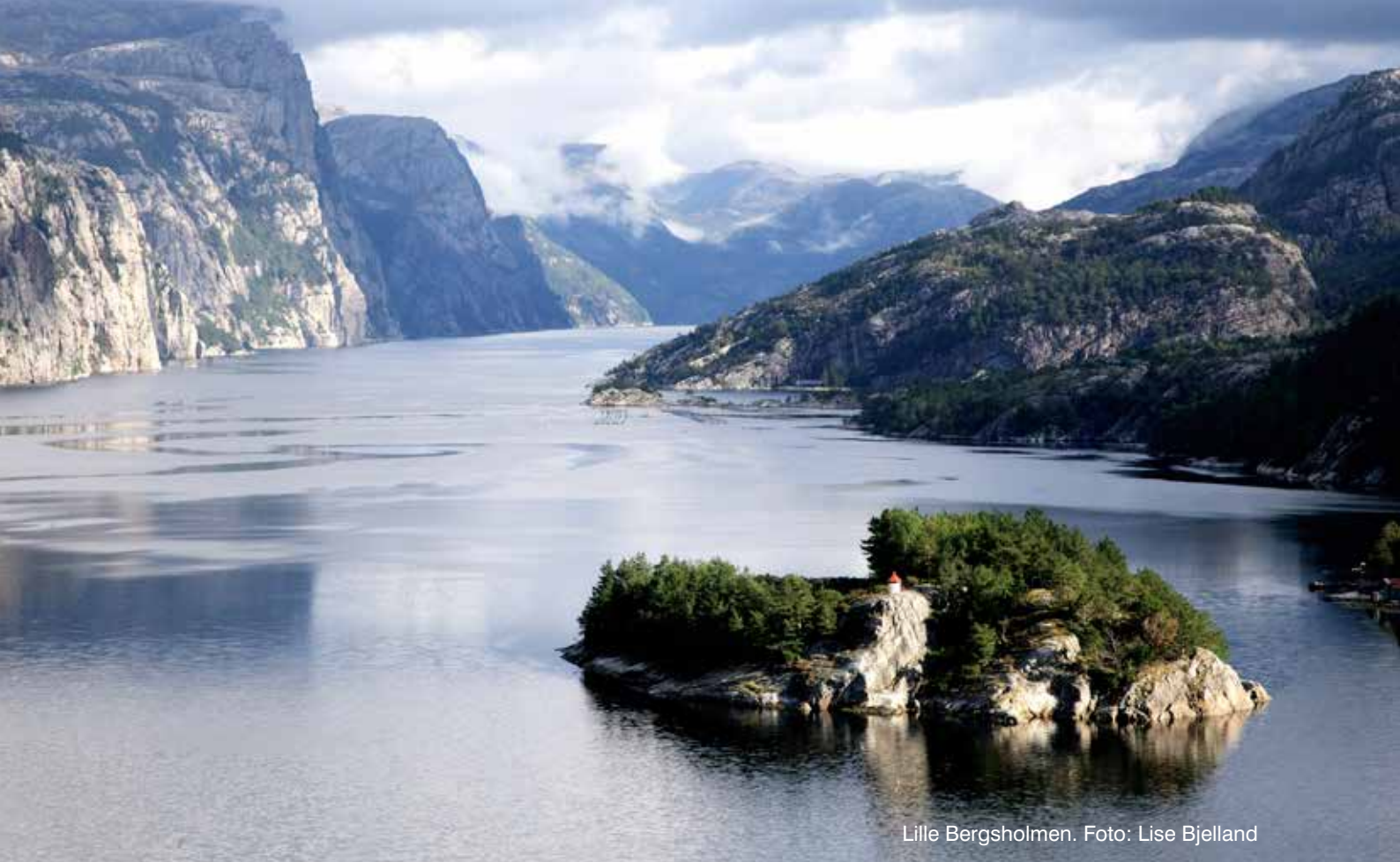
Lille Bergsholmen.