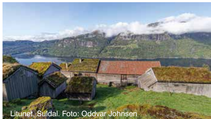
Litunet, Suldal.

Ryfylke Friluftsråd har i samråd med sine medlemskommuner, Rogaland fylkeskommune og ulike organisasjoner kommet frem til følgende ønsker for sikring av nye friluftslivsområder. Sikring er et samlebegrep for servituttavtaler eller kjøp av attraktive eiendommer for friluftsliv. I denne sammenhengen er det viktig å understreke at all strandlinje i våre medlemskommuner, i varierende grad, kan være interessant for bading, stangfiske, padling, båtliv og turområder/friluftspor.